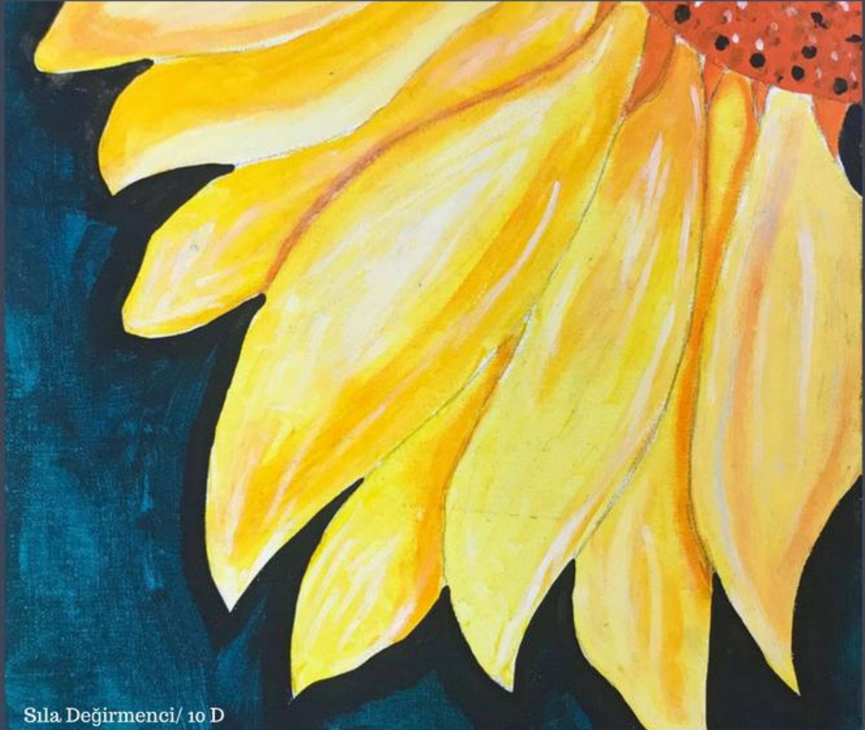
Sıla Değirmenci/ 10 D